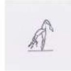
Sgambata con gamba alta flessa (gamba d'appoggio in relevé o in posé)